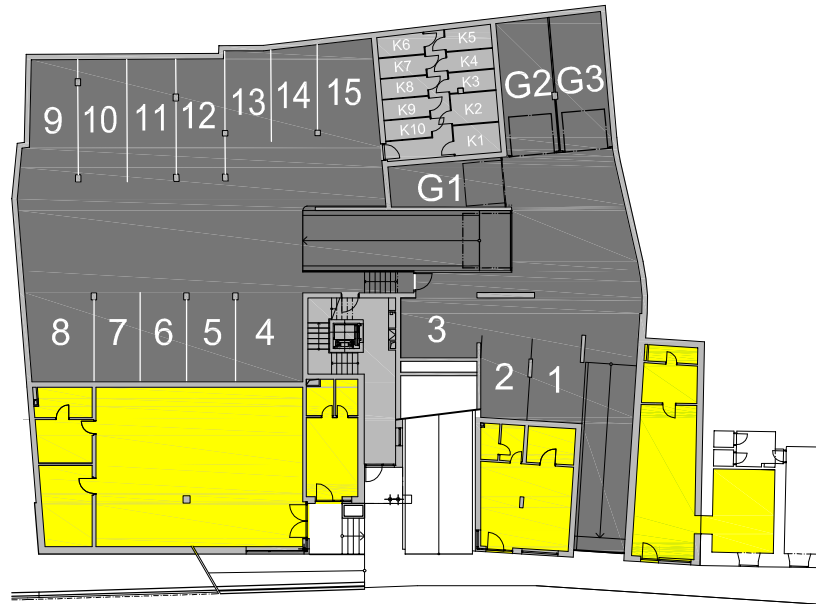
SUTERÉN - 1.PP